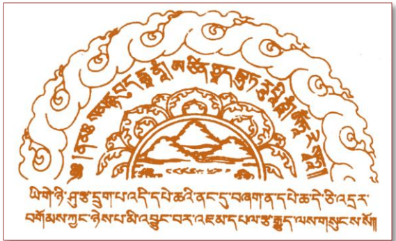
此咒置经书中可灭误跨之罪