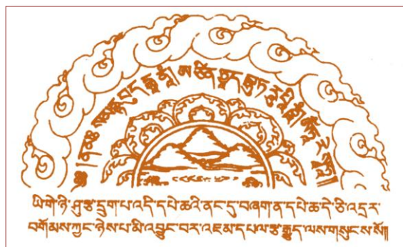
此咒置经书中可灭误跨之罪